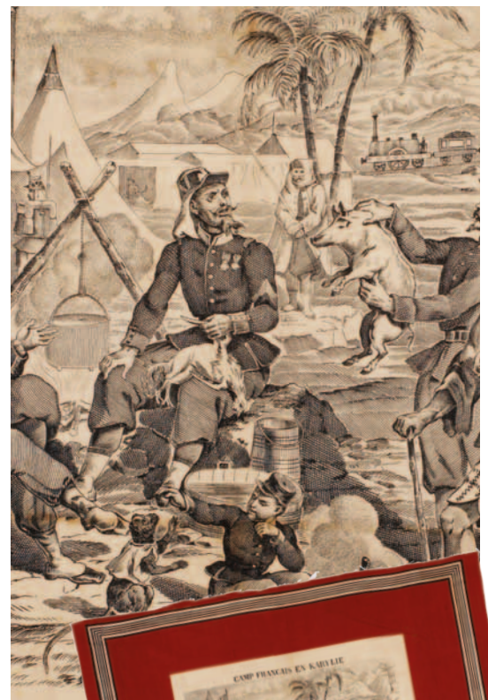
▶ Le camp français en Kabylie. Mouchoir de coton imprimé, 1857 76 x 71 cm. Prêt du musée de l'Impression sur Étoffes de Mulhouse.

Dans le contexte de la conquête du territoire algérien, il évoque la répression de la révolte de la Kabylie par les troupes françaises. On voit à l'arrière-plan un train rappelant le décret du 8 avril 1857, par lequel l'empereur Napoléon III décida la construction du chemin de fer algérien, dont la première ligne a relié Alger à Blida.