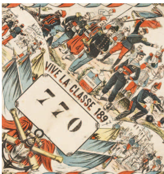
◀ Bulletin de tirage au sort. Vive la classe 1897 , lithographie coloriée, 1897 / Imprimerie MV, Pont-à-Mousson. Collection musée de l'Armée.

mouchoir commémoratif ou d'instruction, foulard haute couture... Datant des XIX e et XX e siècles, ils ont en commun – tel est le fil conducteur de l'exposition –, d'être les supports matériels d'une vision de l'armée autant que les accessoires de pratiques caractéristiques du monde militaire ou civil voire communes aux deux. Tour à tour mouchoir et tableau, pansement et accessoire de mode, bonnet de nuit improvisé ou baluchon de fortune, le carré est, dans chacune de ses variations, un objet riche de sens, témoin matériel de l'esprit d'une époque.